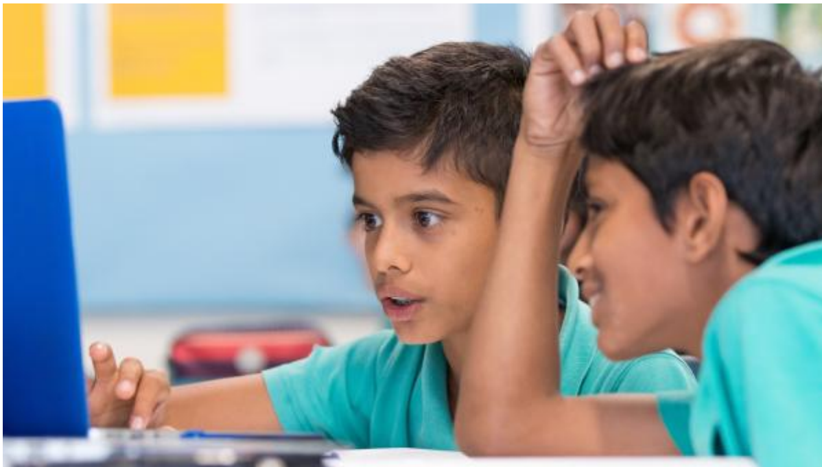
Clase de Humanidades en Asia del Sureste.

A través de esta integración buscada, los colegios quieren evitar la tendencia de los alumnos de juntarse con aquellos que son más parecidos a ellos, ya sea por nacionalidad o capacidad socioeconómica. “Comienzan con el simple hecho de tener que compartir cuarto con personas muy diferentes a ellos. Comen juntos, tienen que negociar cuestiones como a qué hora se acuestan, quién apaga la luz... cosas muy mundanas. Antes que ser de cualquier país son adolescentes y hay necesidades universales”, recalca Sermeño.