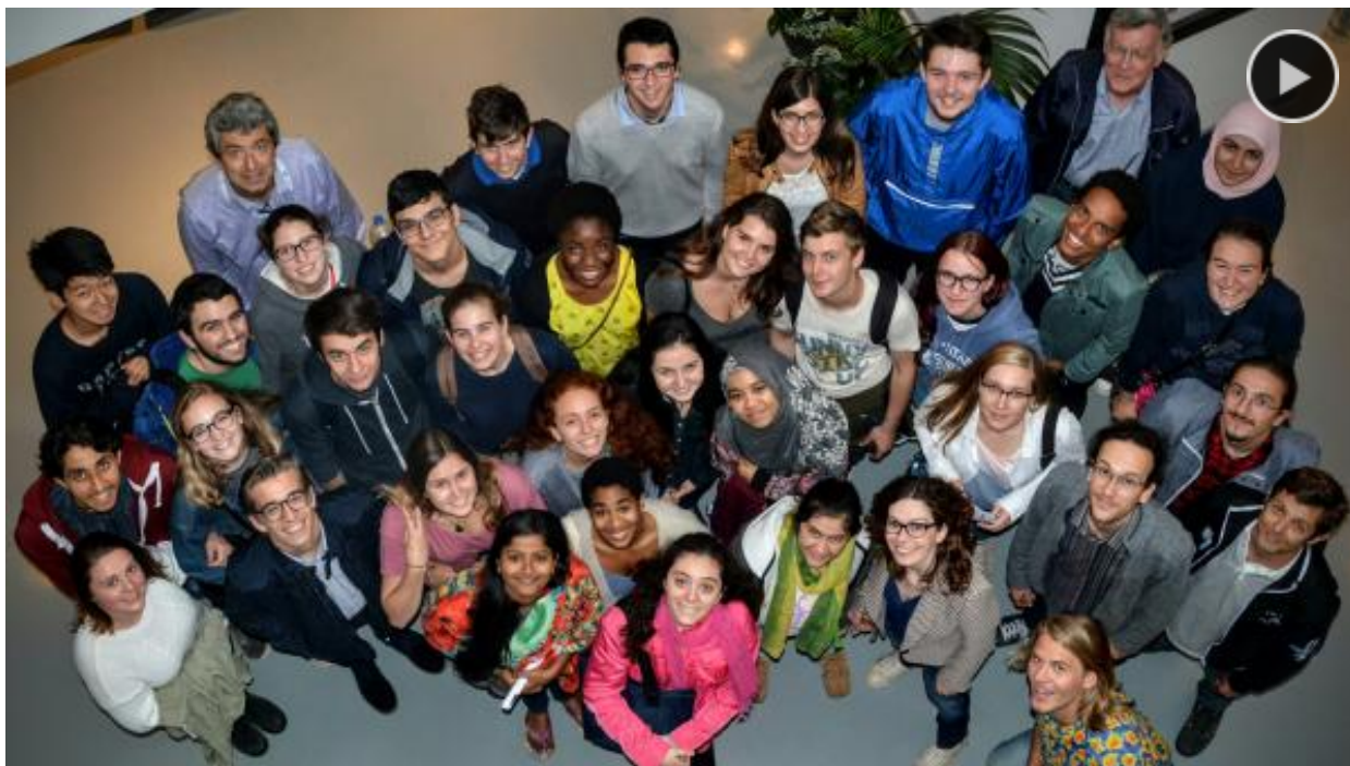
United World College del Adriático. | UWC